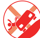
横転や転落による事故