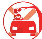
樹木の枝と機械に挟まれる事故